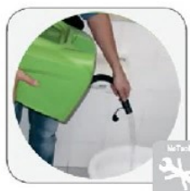
جدا شدن آسان مخزن آب کثیف که علاوه بر راحتی در تخلیه و شستشو، دسترسی به قسمت‌های درونی دستگاه را تسهیل می نماید.