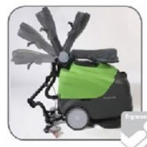
دسته قابل تنظیم دستگاه این امکان را به اپراتور می دهد تا با تنظیم زاویه، مکان‌های غیرقابل دسترسی مثل زیر میزها، زیر پله ها و... را تمیز نماید.