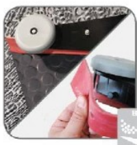
طراحی ۷ شکل تیغه تی به منظور بالا بردن کیفیت و کارایی مکش