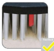
دارای نشانگر ارتفاع مجاز برس برس جهت اعلام زمان تعویض