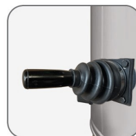
دارای تکان دهنده مکانیکی فیلتر جهت جلوگیری از انباشته شدن گرد و غبار و انسداد منافذ فیلتر