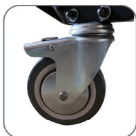
دارای چرخ های بزرگ جهت افزایش ایستایی دستگاه