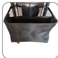
دارای محفظه نگهدارنده لوازم جانبی در پشت دستگاه که در دو حالت عمودی و افقی قابل تنظیم می باشد.