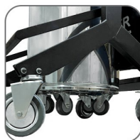
مجهز به سیستم تخلیه مخزن آسان باز شونده بدین نحو که با جدا شدن کامل مخزن از دستگاه و قرار گیری بر روی چرخ تخلیه و جابجایی مخزن را تسهیل می نماید.