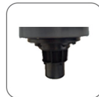
دارای شناور کنترل کننده سطح مایعات جهت جلوگیری از ورود مایعات به موتور