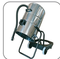
مجهز به سیستم تخلیه مخزن به روش دورانی حول محور بدنه جهت تخلیه آسان