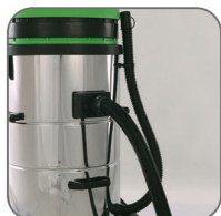
دارای شیلنگ تخلیه مخزن آب کثیف جهت راحتی اپراتور