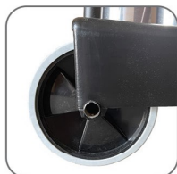
دارای چرخ های بزرگ جهت افزایش ایستایی دستگاه