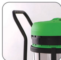
طراحی منحصر بفرد دسته دستگاه جهت جابجایی آسان