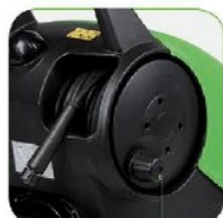
دارای قرقره شیلنگ جمع کن