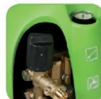
دارای پیچ تنظیم فشار آب خروجی، متناسب با میزان آلودگی