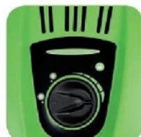
دارای پیچ تنظیم جهت کم و زیاد کردن میزان ریزش مواد شوینده