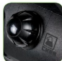
دارای مخزن مواد شوینده با ظرفیت ۲۵ لیتر