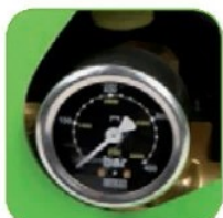
دارای نشانگر میزان فشار آب خروجی