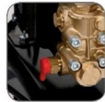
دارای پیچ تنظیم فشار آب خروجی، متناسب با میزان آلودگی