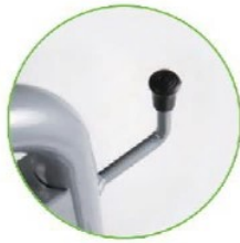
دارای نگهدارنده لانس

دارای موتور ۴ پل مداوم کار (۱۴۰۰ دور در دقیقه)