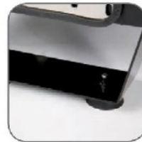
طراحی ضد لرزش شاسی