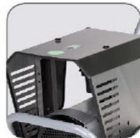
طراحی منحصر به فرد تمام استیل کاور دستگاه