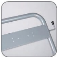
طراحی منحصر به فرد دسته جهت جابجایی آسان بر روی هر گونه سطح