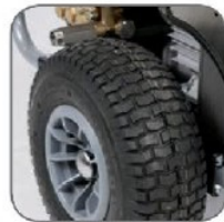
دارای چرخ های بزرگ جهت تسهیل در جابجایی دستگاه