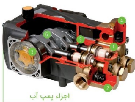
اجزاء پمپ آب

ساختار ساده طراحی موتور جهت دسترسی به قسمت های مختلف