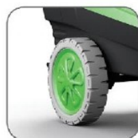
دارای چرخ های بزرگ جهت تسهیل در جابجایی دستگاه