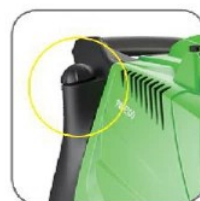
دارای مخزن مواد شوینده با ظرفیت ۱.۲ لیتر