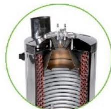
مجهز به بویلر برقی با ظرفیت بالا کاملاً انحصاری (ساخت کمیانی IPC)

دارای موتور ۴ پل مداوم کار (۱۴۰۰ دور در دقیقه)