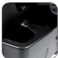
دارای محفظه نگهدارنده لوازم جانبی