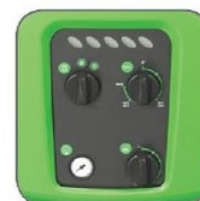
دارای صفحه فرمان ساده با قابلیت تنظیم دمای آب خروجی