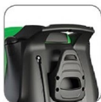
طراحی منحصر به فرد دسته جهت جابجایی آسان بروی هر گونه سطح