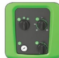
دارای صفحه فرمان ساده با قابلیت تنظیم دمای آب خروجی