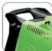
طراحی منحصر به فرد دسته جهت جابجایی آسان بروی هر گونه سطح