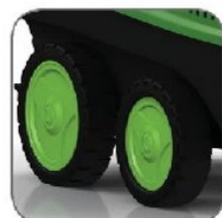
دارای چرخ های بزرگ جهت تسهیل در جابجایی دستگاه