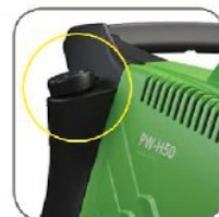
دارای مخزن مواد شوینده با ظرفیت ۱.۲ لیتر