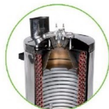
مجهاز به بویلر دیزلی با ظرفیت بالا کاملاً انحصاری (ساخت کمپانی IPC)

دارای موتور ۴ پل مداوم کار (۱۴۰۰ دور در دقیقه)