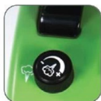
دارای پیچ تنظیم جهت کم یا زیاد کردن حجم بخار خروجی