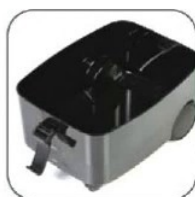
دارای سیستم فیلترینگ بوسیله آب که علاوه بر سادگی در طراحی، سبب افزایش طول عمر موتور وکیوم می گردد