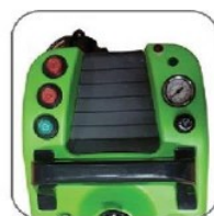
دارای صفحه فرمان ساده جهت بررسی وضعیت لحظه ای دستگاه