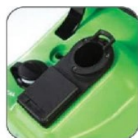
دارای پنل ایمنی محل اتصال اوله خرطومی به دستگاه جهت جلوگیری از آسیب دیدن