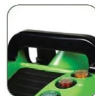
طراحی منحصر به فرد دسته جهت جابجایی آسان