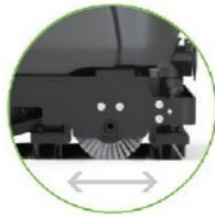
امکان خشک کنی سطح در هر دو جهت حرکت دستگاه (عقب و جلو)

ریزش مرکزی آب بر روی برس که منجر به توزیع یکنواخت آب در تمامی سطح برس و به تبع آن شویندگی همگون دستگاه می گردد.