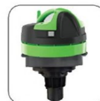
دارای شناور کنترل کننده سطح مایعات جهت جلوگیری از ورود مایعات به موتور