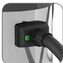
دارای قفل نگهدارنده لوله خرطومی جهت جلوگیری از افتاب جریان مکش