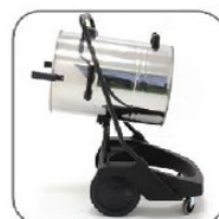
مجهز به سیستم تخلیه مخزن به روش دورانی حول محور بدنه جهت تخلیه آسان