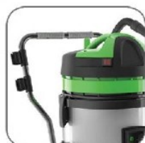
طراحی منحصر به فرد دسته دستگاه جهت جابجایی آسان