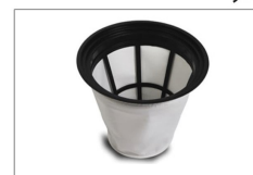
دارای فیلتر پارچه ای قابل شستشو از جنس پلی استر با قابلیت جذب ذرات گرد و غبار