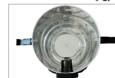
دارای مخزن زباله از جنس استیل