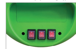
دارای کاور ضد رطوبتی کلیدهای (ON-OFF) جهت جلوگیری از نفوذ آب و رطوبت